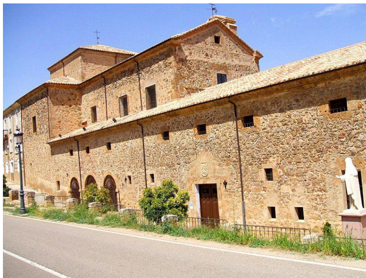
Convento de la Concepción de Ágreda

La Venerable confiesa que ella, en su primera infancia, parecía un tanto apocada e inútil, y con el fin de que espabilara, su madre le trataba con dureza: “Con verdad puedo decir que en mi vida les vi [a los padres] el rostro sereno hasta después de religiosa” .