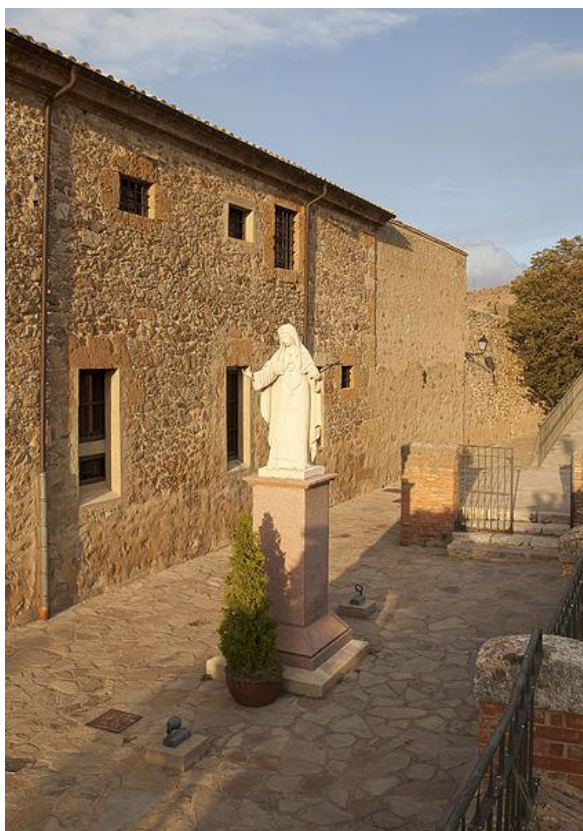
Estatua de la Venerable María de Jesús de Ágreda en el exterior del convento.