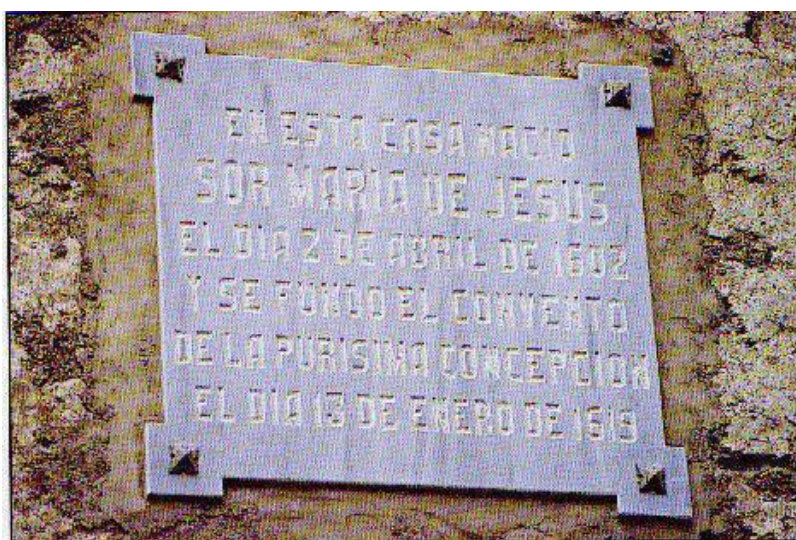
Placa ubicada en la fachada de la casa natal de la religiosa que refleja la fecha de la fundación del convento de la Purísima Concepción el 13 de enero de 1619

No cabe duda que uno de los episodios más curiosos de la vida de Sor María es el de sus relaciones con el rey Felipe IV, con quien mantuvo correspondencia epistolar por espacio de más de veinte años (1643-1665). Desde luego que las relaciones de Sor María con el rey de España no son más que un capítulo, el más importante si se quiere, en el conjunto de las múltiples relaciones y de la variadísima y dilatada correspondencia epistolar que sostuvo la Venerable con múltiples personajes de su tiempo.