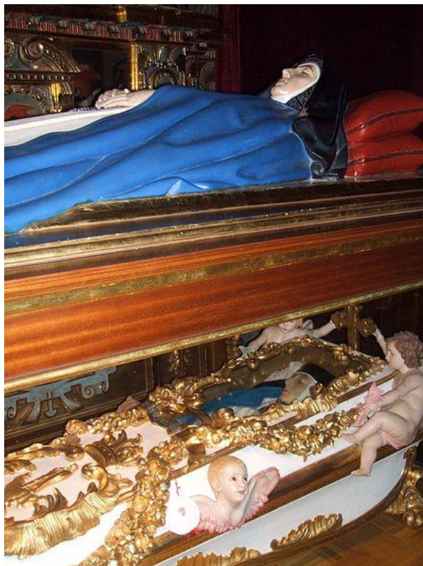
Estatua yacente (arriba) y cuerpo incorrupto (debajo) de Sor María de Jesús de Ágreda, en la iglesia del Convento de las Concepcionistas de Ágreda.

En 1673 se inició su proceso de beatificación, llegando a ser declarada Venerable por Clemente X.