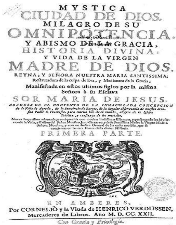
Portada de la revelaciones de de María de Ágreda, 1722, Verdussen, Antwerp.

Tuvo fama de santa por sus penitencias y mortificaciones corporales, llegando a ser procesada y absuelta por la Inquisición como recordamos en estas líneas. Mantuvo una larga y nutrida correspondencia (1643, 1665) con Felipe IV, de quien fue consejera en asuntos de Estado. En 1627, con tan sólo 25 años, sería nombrada abadesa del convento franciscano de Ágreda, fundado por sus padres.