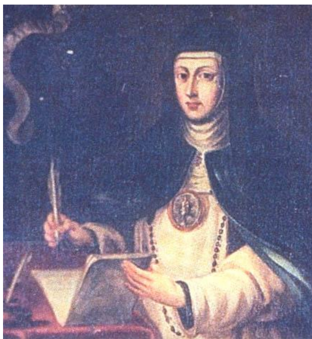
Venerable Madre Sor María de Jesús de Ágreda O.I.C. (2 de abril de 1602-24 de mayo de 1665)

Desde la visita de Benavides los “viajes” de la monja a América fueron en disminución hasta extinguirse por completo. Todo transcurrió durante un período que abarcó desde 1620 a 1631, por lo que su misión parecía haber finalizado, calculándose, según la religiosa, que los viajes habían sido unos quinientos. Lo que resultaba más curioso, al contrario que en otros casos de bilocación, es que ella recordaba detalles minuciosos de sus desplazamientos e incluso que llevaba objetos materiales consigo.